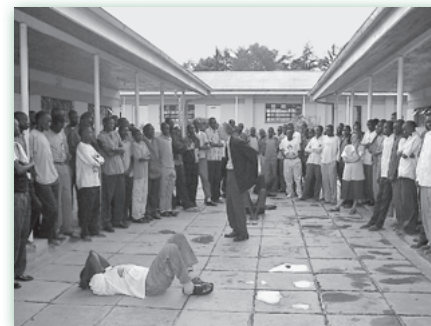
Sudanesische Kriegsflüchtlinge lernen Übungen

Das zweite Fallbeispiel ist eine Erfahrung aus der Zeit meiner dreijährigen Arbeit im Sudan. Da wurde ich einmal gebeten, eine Schule zu besuchen, deren ganze Schülerschaft aus sudanesischen Flüchtlingsjungen bestand. Die Lehrer hatten Schwierigkeiten mit diesen Schülern, und sie sahen auch, dass ihre eigenen Beziehungen innerhalb des Kollegiums vom Verhalten der Schüler schwer belastet waren. Als ich ankam, befragte ich sowohl die Lehrerschaft als auch die versammelten Schüler. Ich entdeckte, dass das Kollegium unter sekundärem Trauma – einer Traumatisierung durch Ansteckung – litt. Dies war die unbewusste