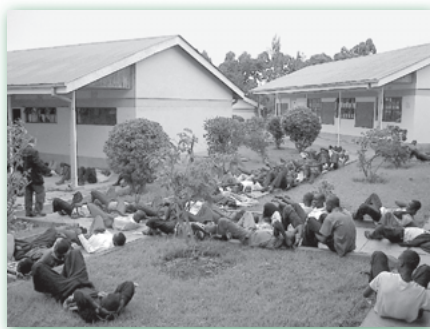
Kitale High School, Rift Valley, Kenia

Da es hier offensichtlich um den langfristigen Erholungsprozess einer ganzen Schülerschaft ging, war es notwendig, die oben erwähnten